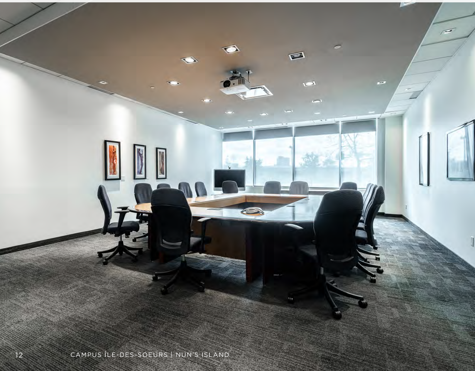
Salle de conférence | Conference room