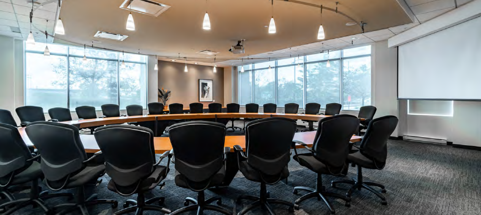
Salle de conférence | Conference room