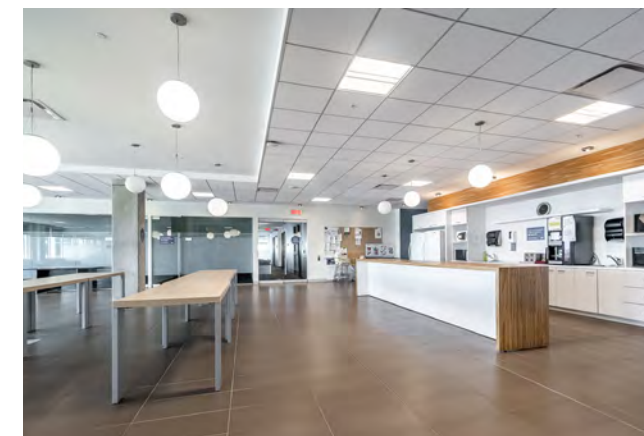
Cuisine | Kitchen