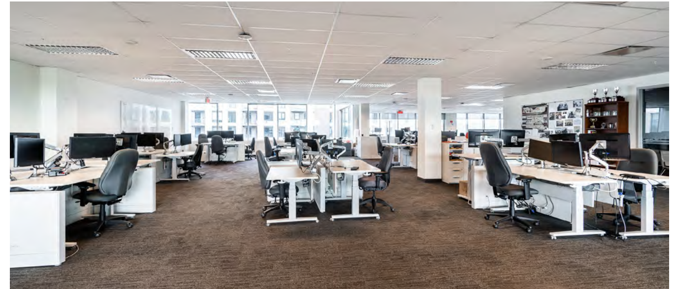
Espace de bureaux | Office space