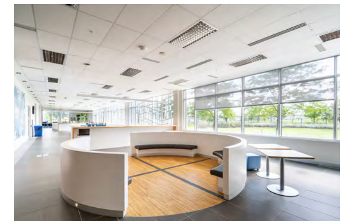
Espace commun | Common space