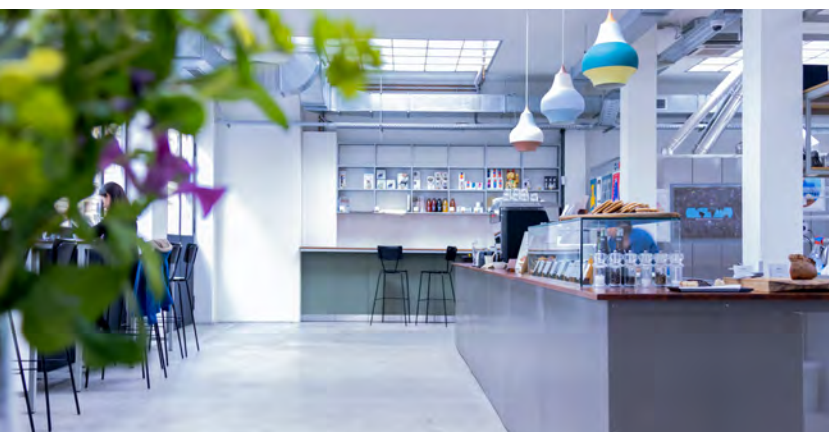
Cafétéria à venir | Cafeteria to come - Photo à titre d'exemple | Sample photo