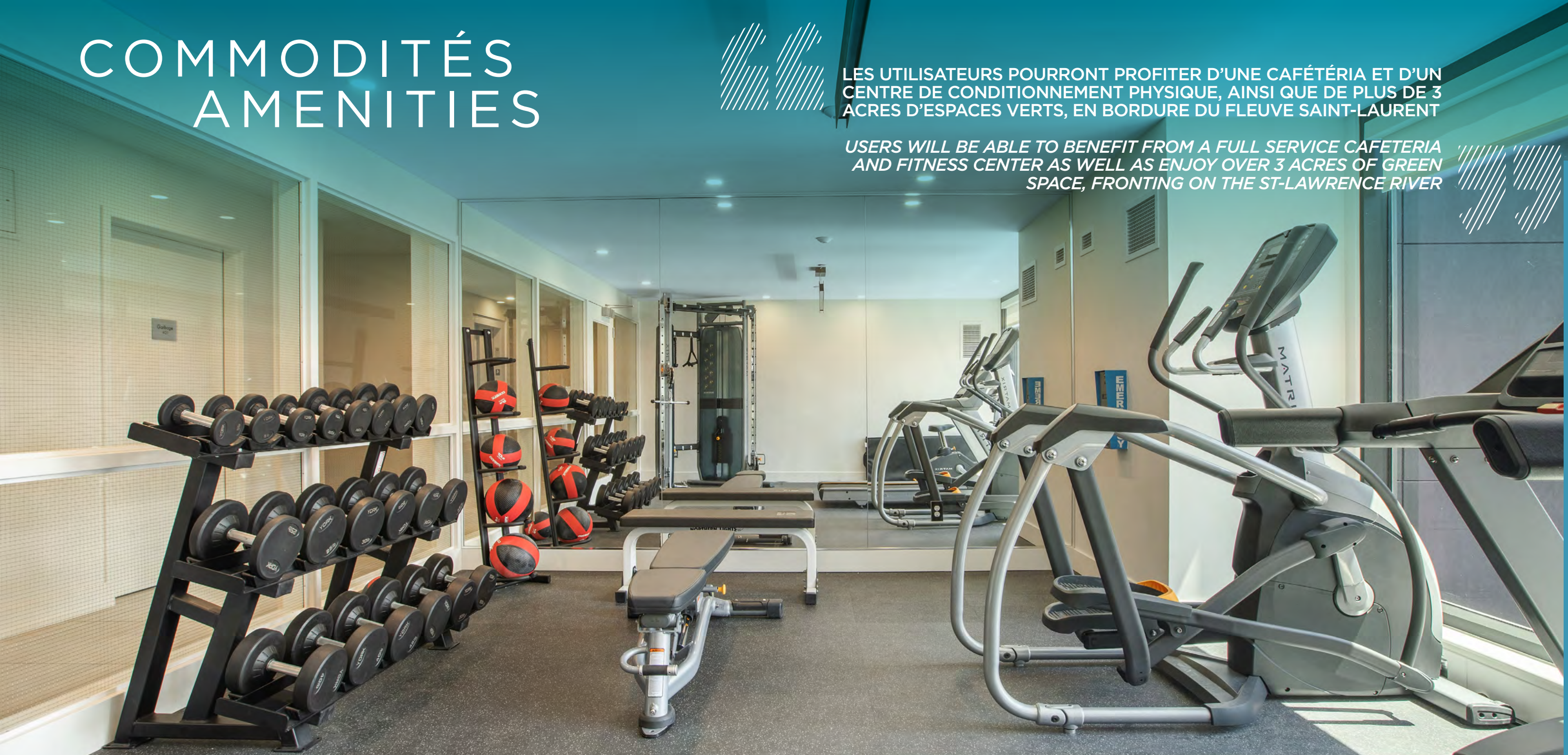
Salle de sport à venir | Fitness center to come - Photo à titre d'exemple | Sample photo