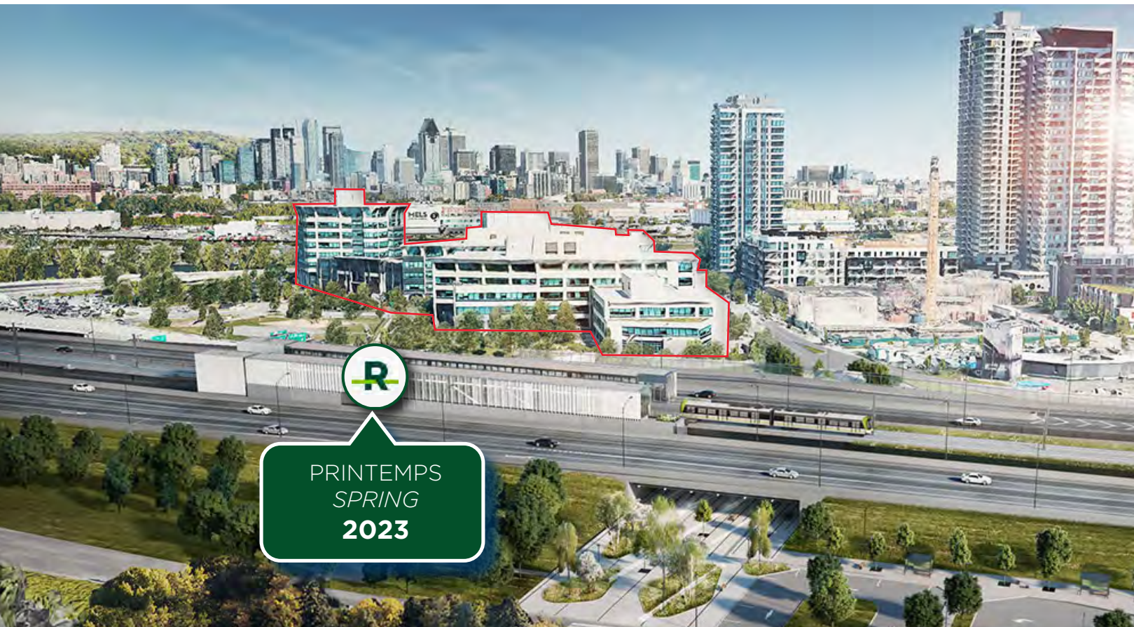
2 min. de marche du Campus Île-des-Soeurs | 2 min. walk from Nun's Island Campus